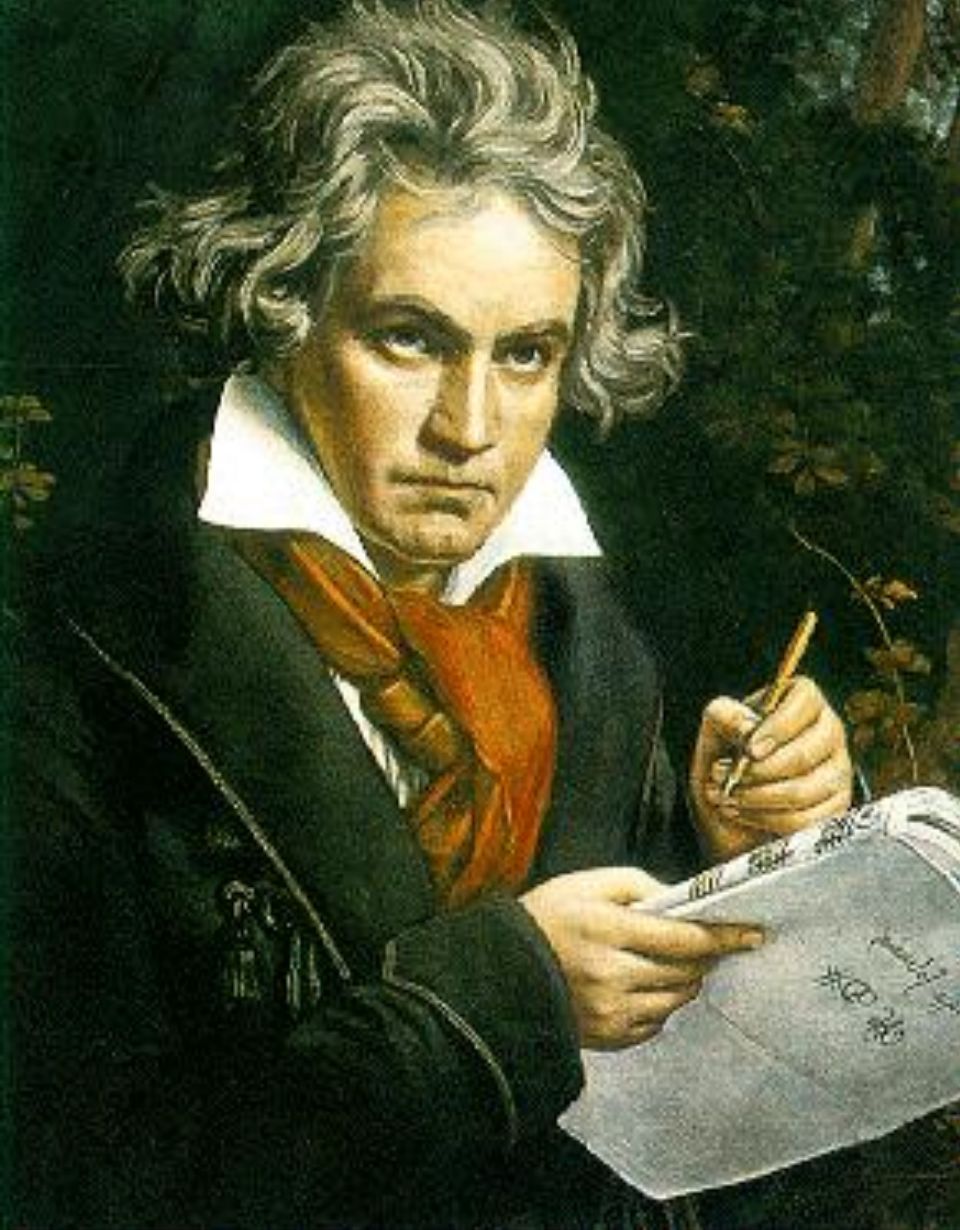
Ludvig van Beethoven 1770-1827