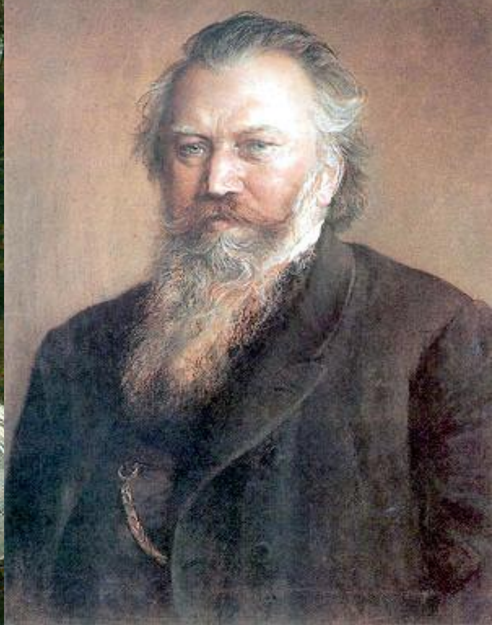
Johannes Brahms 1833-1893